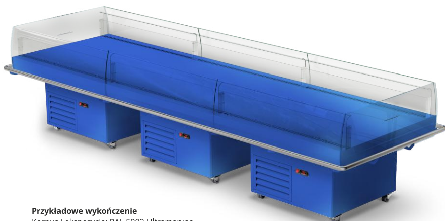
Przykładowe wykończenie Korpus i ekspozycja: RAL 5002 Ultramaryna