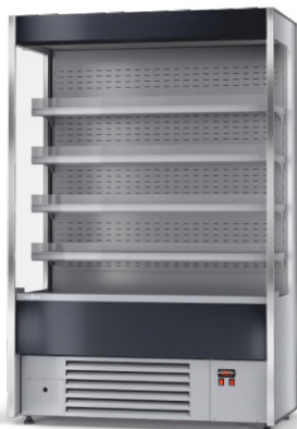
Regał chłodniczy otwarty RCh-O/133