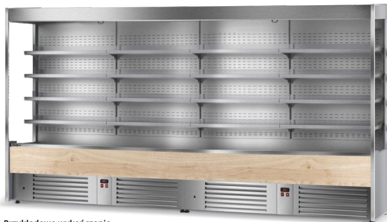
Ciąg 2 modułów regałów chłodniczych otwartych RCh-O/196

front górny i dolny: RAL 9005 Czarny głęboki wnętrze i cokół: RAL 7004 Szary sygnałowy bok: przeszklony z szarym wykończeniem